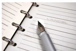
①アンケートにご回答ください