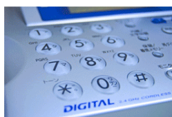
②そのままFAXしてください